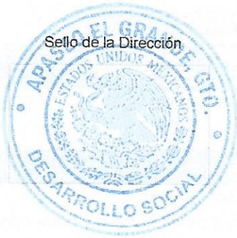
Sello de la Dirección

Correo electrónico: contraloría_ag@hotmail.com